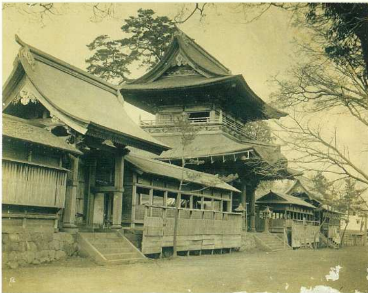
楼門古写真(明治時代末期頃)