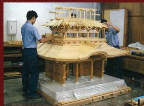
阿蘇神社楼門 1/10 スケール模型 制作：熊本工業高校