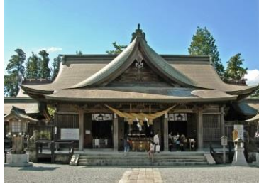
※写真は熊本地震前の様子

拝殿・翼廊 (全壊) 昭和23年(1948) 【指定寄附金事業】 再建工事実施中 (令和元年9月～3年6月)