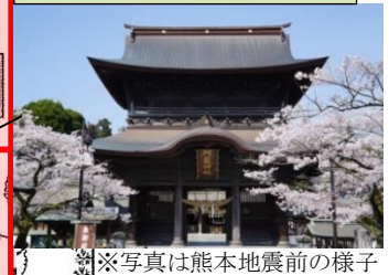
※写真は熊本地震前の様子

【重文】楼門 (全壊) 嘉永3年(1850) 全解体修理 組立工事実施中 (平成28年11月～令和5年12月)