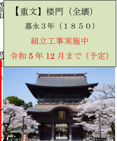
※写真は熊本地震前の様子