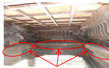
この部分の部材です

倒壊時に生じた割れや表面の 疵・へこみなどを、埋木・矧木・ 接着剤付けしました。