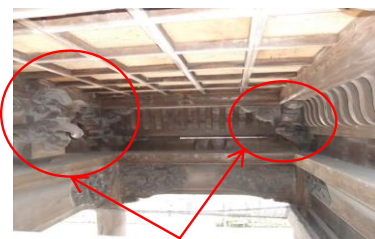
この部分の部材です