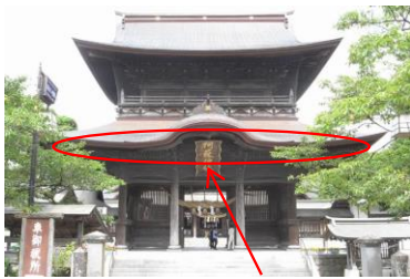
この部分の部材です

水腐れや倒壊時に生じた割れなどを、矧木・接着剤付けし、一部補強材の取り付けを行いました。