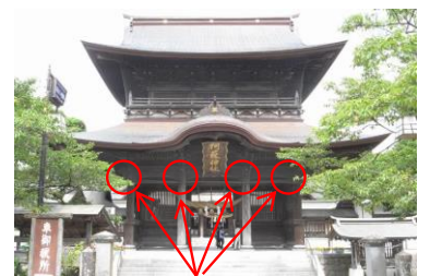
この部分の部材です