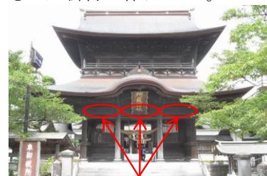
この部分の部材です

倒壊時に生じた表面の疵・へこみを埋木・矧木しました。 割れて脱落した渦の彫刻部分は、破片が見つかったものは接着剤付けし、見つからなかったものは新材で作りました。