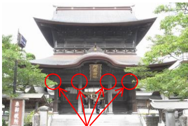
この部分の部材です

柱の頭に取り付く頭貫木鼻(かしらぬききばな)は、色々な箇所です。大小様々な破損をしていますので、いたるところを修理しています。