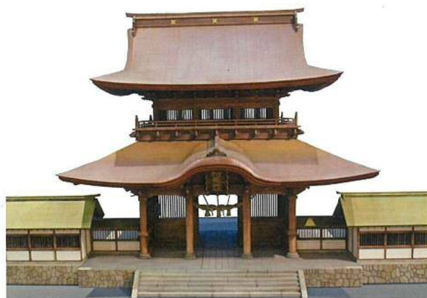
特撮用ミニチュア 阿蘇神社楼門