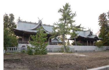
足場解体後の様子です