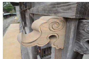
取付後の状態です