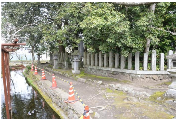
一之神陵周囲石垣

段差になっている箇所に石垣が築かれています。どれも野面のような石垣となっています。神陵のまわり周囲のものは角が丸い石が多く使用されており、池周囲・石碑周囲ものは、様々な形の石が使用されています。いつの時代のものかは不明です。