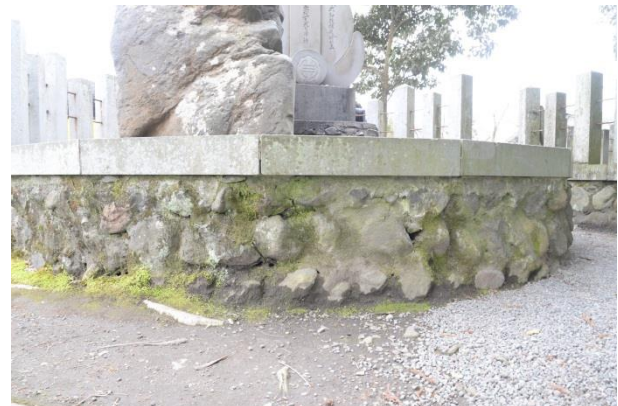
石碑周囲石垣 詳細

以上、各石垣・石積みを見てきました。同時期と思われるものでもそれぞれが異なる表情をしており、境内の景色に変化を与えています。石垣は城郭のものが有名ですが、このように神社やお寺にも様々な時代の石垣・石積みがあります。石垣・石積みがあるのに気が付いたら、是非鑑賞してみてください。(石田 陽是)