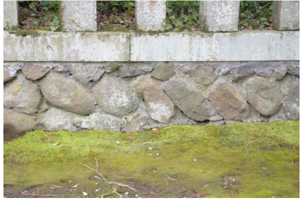
二之神陵周囲石垣 詳細