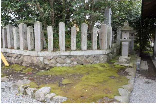
二之神陵周囲石垣