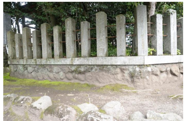
一之神陵周囲石垣 詳細